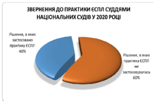
Діаграма 1. Звернення до практики ЄСПЛ у 2020 році

У науковій статті розглянуто особливості застосування практики Європейського суду з прав людини в кримінальному праві України. Автор глибоко досліджує особливості імплементації міжнародної судової практики у розвиток кримінальної юстиції та кримінально-правових відносин. Дослідження ґрунтується на емпіричному матеріалі, аналіз якого відображено у відповідних діаграмах за допомогою методу моделювання. Звернено увагу на тенденції посилення кореляції національного кримінального законодавства із міжнародним та звернення до міжнародних стандартів у сфері захисту прав людини. Дослідник звертається до вивчення та запозичення європейського правового досвіду та правової доктрини, які відіграють важливу роль